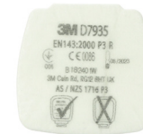
D7935 P3 R