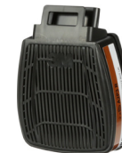
D8095 A2P3 R