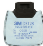
D3128 P2 R/ ochrona przed pyłami i drażniącymi zapachami