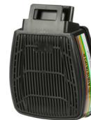
D8094 ABEKP3 R