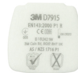
D7915 P1 R