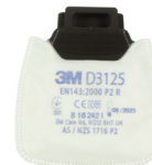
D3125 P2 R