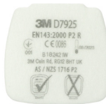
D7925 P2 R