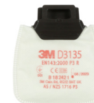
D3135 P3 R