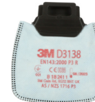
D3138 P3 R/ ochrona przed pyłami i drażniącymi zapachami