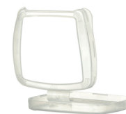
Pokrywa filtra D701

Półmaska serii HF-800 wraz z filtrami ma opór wdechowy poniżej 5 milibarów przy przepływie ciągłym 95 l/min.